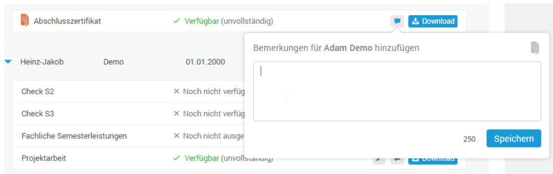
Abbildung 5: Bemerkungen zu Zertifikaten

Zum Teilzertifikat Fachliche Semesterleistungen, zum Teilzertifikat Projektarbeit sowie zum Abschlusszertifikat können Bemerkungen pro Schülerin oder Schüler in elektronischer Form hinzugefügt werden. Die Bemerkungen werden auf die entsprechenden Zertifikate gedruckt.