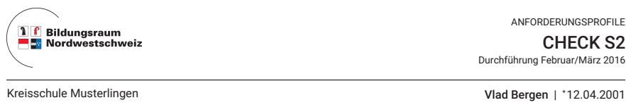
Abbildung 1: Check-Ergebnissen im Vergleich zu einem Anforderungsprofil für die berufliche Grundbildung

Die Check-Ergebnisse können mit den Anforderungsprofilen verglichen werden. Dazu werden beide in einer Grafik dargestellt. Die senkrechten Striche und die blauen Balken zeigen die Ergebnisse in den Checks, die blauen Punkte zeigen die Anforderungen des gewählten Berufs (Abbildung 1). Der Vergleich zeigt, ob die Ergebnisse in den getesteten Kompetenzbereichen über oder unter den schulischen Anforderungen liegen.